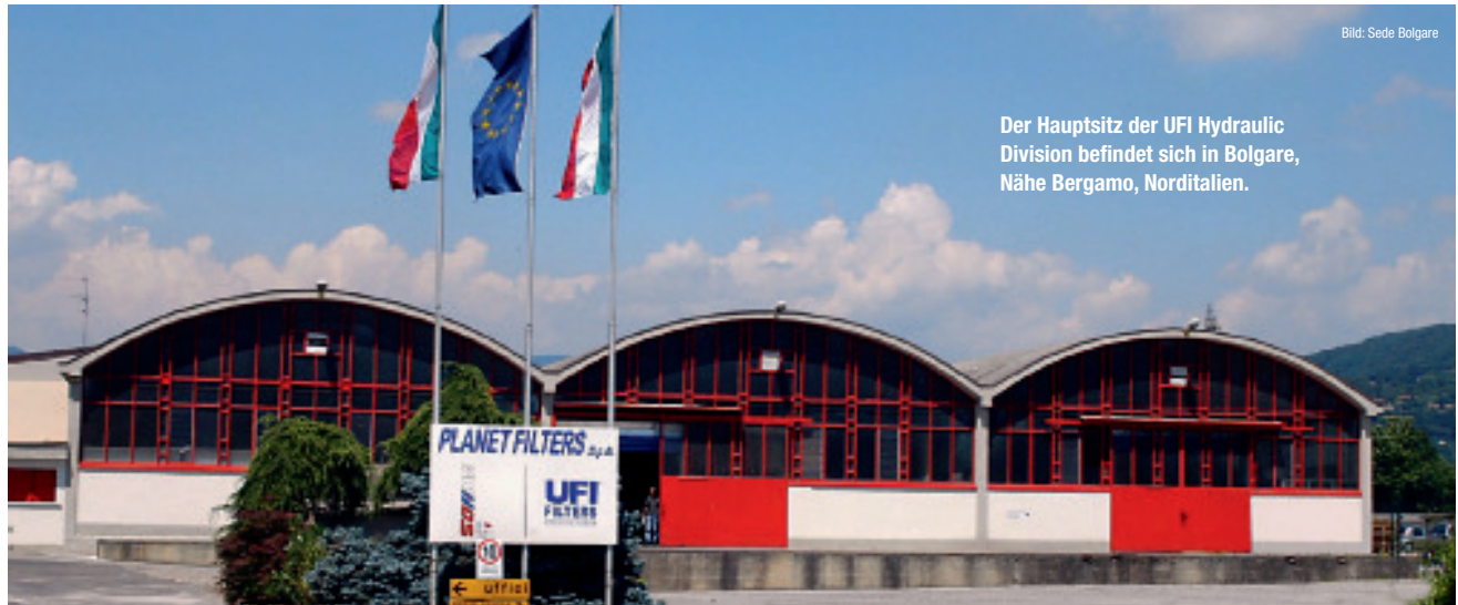
Bild: Sede Bolgare

Der Hauptsitz der UFI Hydraulic Division befindet sich in Bolgare, Nähe Bergamo, Norditalien.