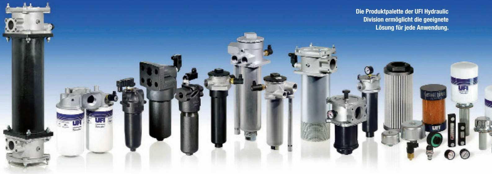
Die Produktpalette der UFI Hydraulic Division ermöglicht die geeignete Lösung für jede Anwendung.